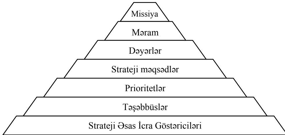
Şəkil. 1. Strateji ierarxiya

Strateji ierarxiyaya dair konseptual yanaşmanın bu istiqamətdə olan beynəlxalq təcrübə və o cümlədən ölkə daxilində Strateji Yol Xəritələrinin mövcud olan strategiya sənədlərindəki yanaşmalara istinad edilərək aşağıdakı şəkildə təsvir edilməsini doğru hesab edirik.